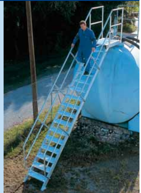
Specialutförande med två handledare.